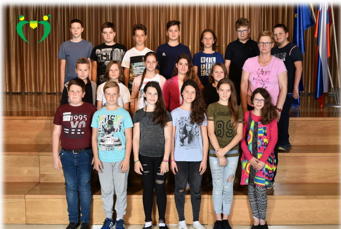
6. a razred OŠ Ferda Vesela Šentvid pri Stični šol. 1. 2017/18