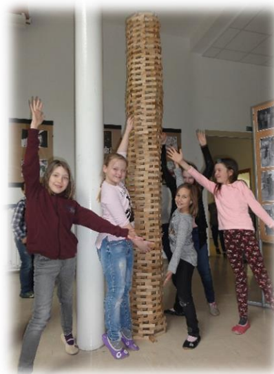
Učenci pri gradnji skulptur v času odmora

Letos je bila v program dela na šoli vključena tudi pregledna razstava likovnih del učencev. Pripravili so pestro paleto likovnih izdelkov od najmlajših do najstarejših. Razstava je bila v sklopu glasbeno likovnega dogodka z naslovom: Zvok in slika na Ferdu kot se šika.