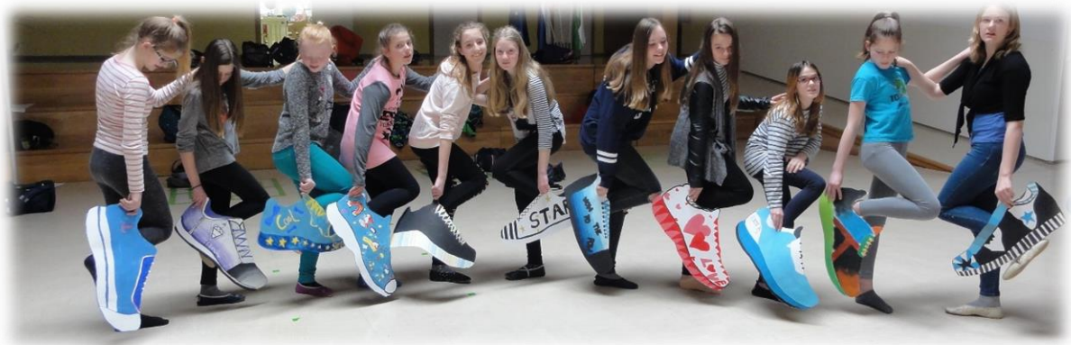
Učenke IP-Likovno snovanje 1 s svojimi kreacijami športne obutve

V šolskem letu 2017/18 se je likovno ustvarjanje učencev poleg rednega dela prepletalo s številnimi dejavnostmi na šoli in izven nje.