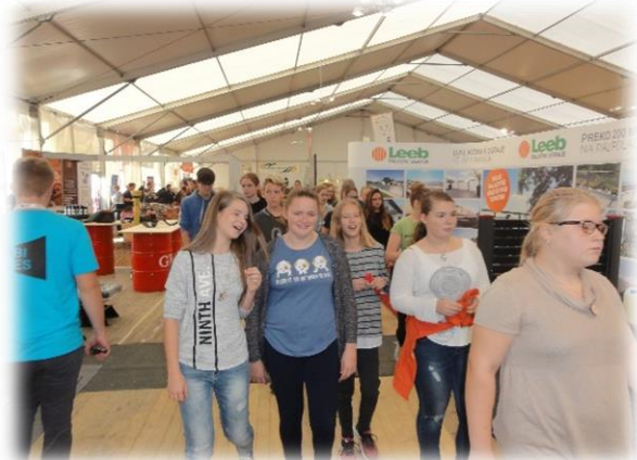
Učenci na Vseslovenskem sejmu v Prapročah pri Temenici

Učenci in učenke so se preizkušali tudi v igri vlog turističnih delavcev, pripravljali praznične pogrinjke in dekoracije jedilniških miz.