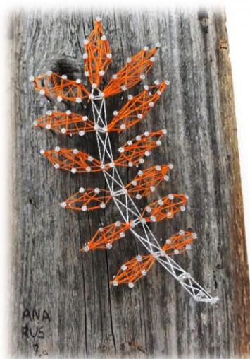
Likovni izdelki učencev OŠ Ferda Vesela Šentvid pri Stični na skupni razstavi

Konec maja je bil v Temenici organiziran naravoslovno likovni tabor, na katerem so učenci povezovali naravo in umetnost. Po opazovanju in domišljiji so učenci upodabljali zelišča in eksotične ptice.