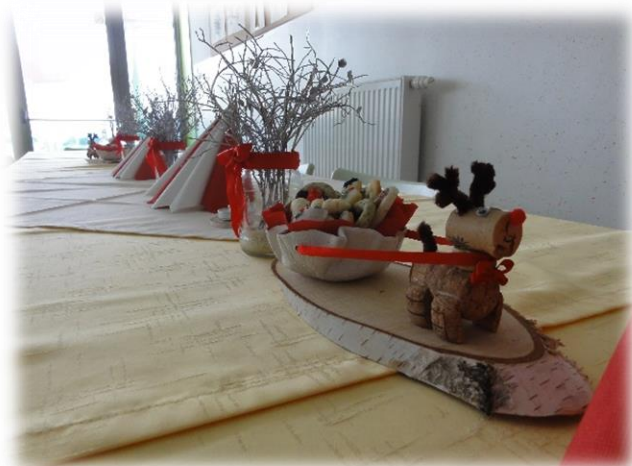
Primera pustne in novoletne dekoracije na jedilniških mizah v šoli

Kontaktirali so tudi z Občino Ivančna Gorica in zaprosili za prikupne izobraževalne table v obliki marjetic, na katerih je zapisan slogan Za nami je čisto . Pomen »marjetic« so predstavili vsem učencem šole, da bi v ozaveščanju za čisto okolje vsi prispevali k lepo urejenemu kraju.