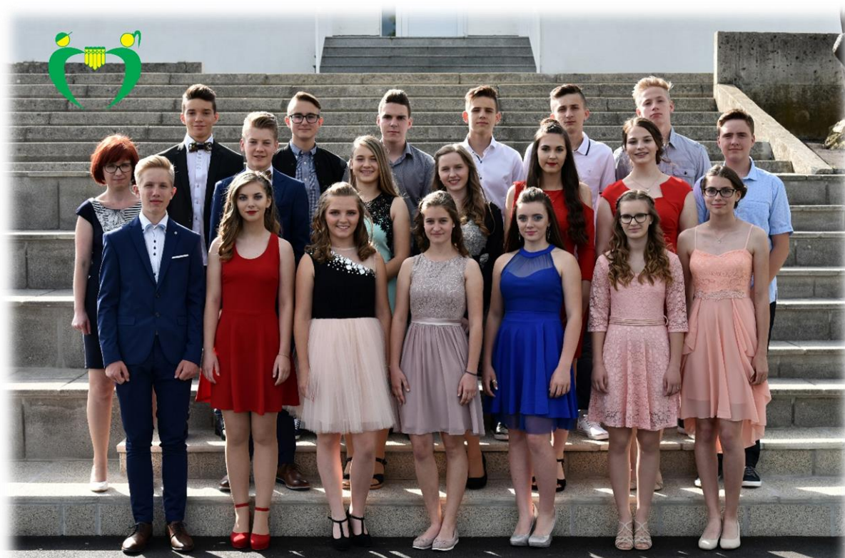
9. b razred OŠ Ferda Vesela Šentvid pri Stični šol. 1. 2017/18