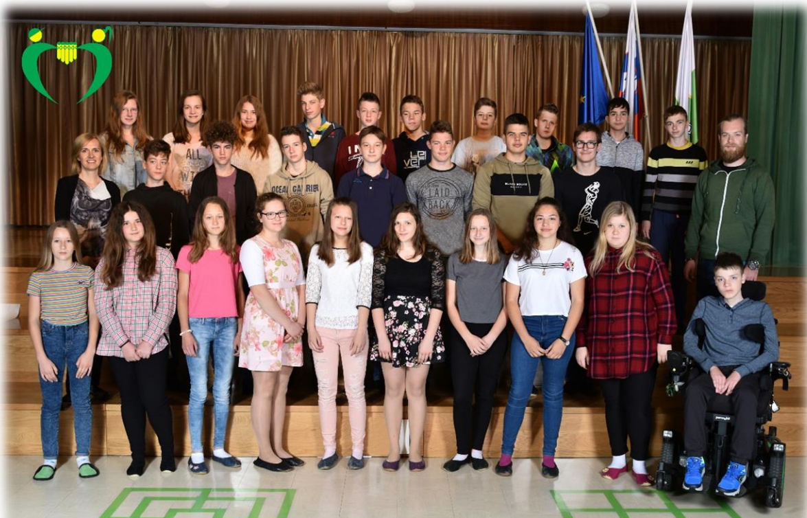
8. a razred OŠ Ferda Vesela Šentvid pri Stični šol. l. 2017/18