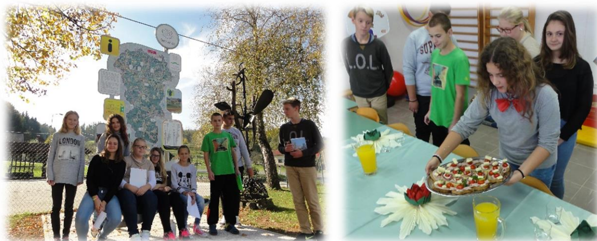
Učenci pred turistično informacijsko tablo v Temenici in v POŠ Temenica, kjer imajo projektni dan

Učenci sedmega, osmega in devetega razreda so v letošnjem šolskem letu obiskovali izbirni predmet turistična vzgoja. Spoznali so teoretične osnove turizma, največ časa pa so se ukvarjali s praktičnimi nalogami, ki so bile povezane s podjetništvom in ustvarjalnostjo.