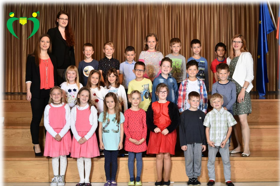
1. a razred OŠ Ferda Vesela Šentvid pri Stični šol. l. 2017/18