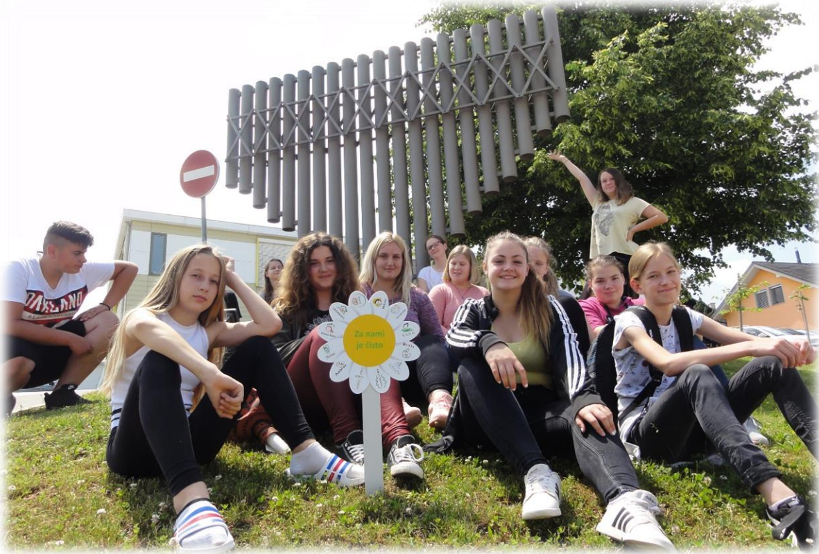
Učenci pred trstenko, spominskim obeležjem Tabora slovenskih pevskih zborov z »marjetico« Za nami je čisto