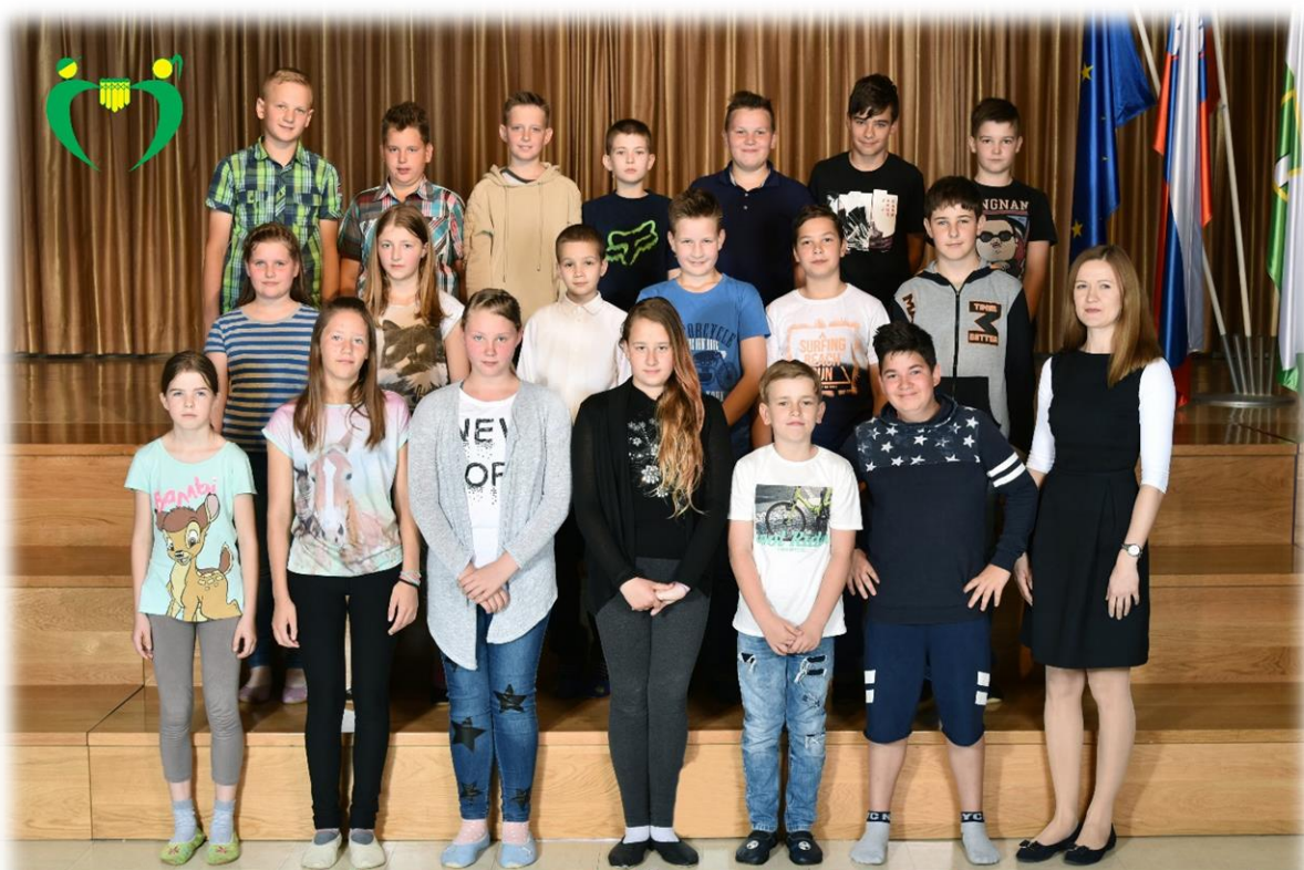
6. b razred OŠ Ferda Vesela Šentvid pri Stični šol. 1. 2017/18