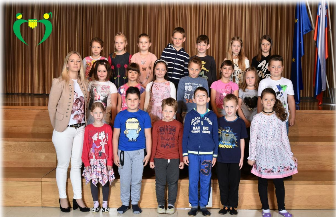
2. a razred OŠ Ferda Vesela Šentvid pri Stični šol. 1. 2017/18