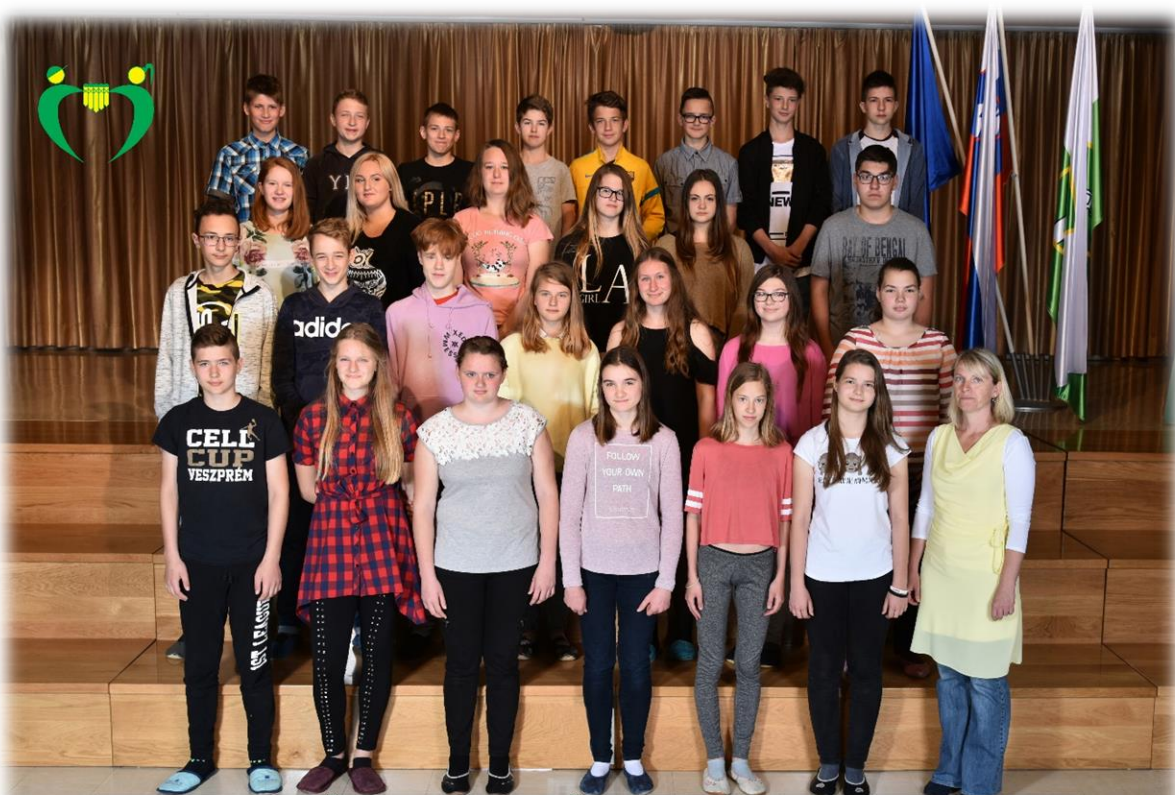
8. b razred OŠ Ferda Vesela Šentvid pri Stični šol. l. 2017/18