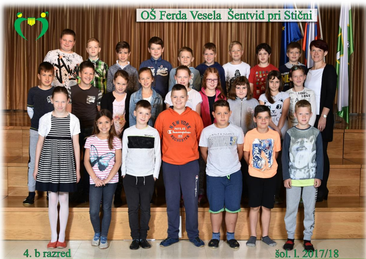
OŠ Ferda Vesela Šentvid pri Stični