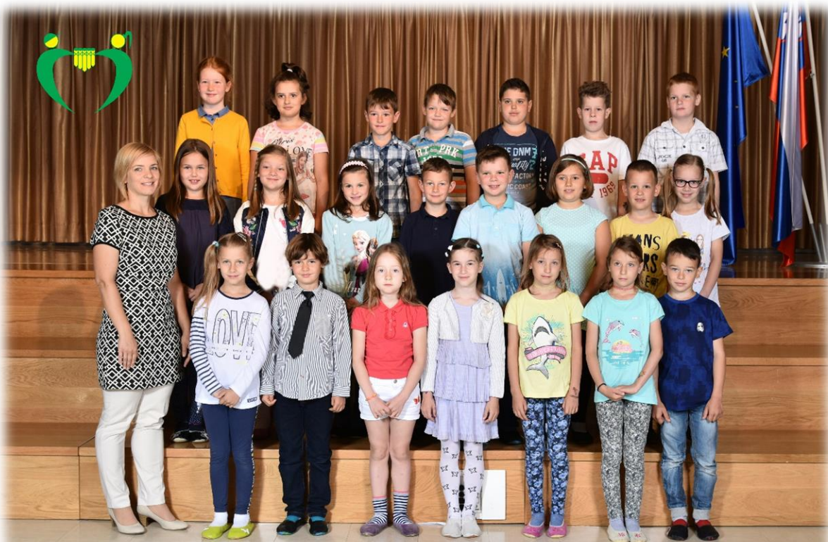
2. b razred OŠ Ferda Vesela Šentvid pri Stični šol. 1. 2017/18