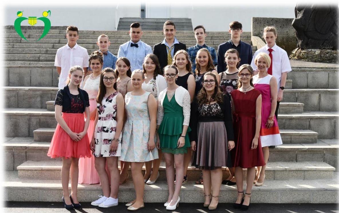
9. a razred OŠ Ferda Vesela Šentvid pri Stični šol. 1. 2017/18