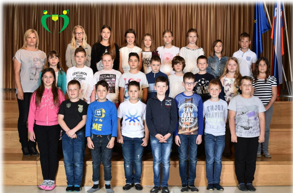
4. a razred OŠ Ferda Vesela Šentvid pri Stični šol. l. 2017/18