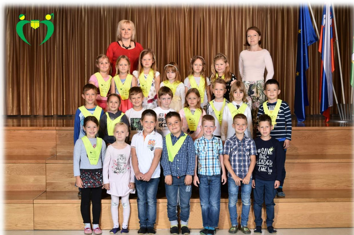
1. b razred OŠ Ferda Vesela Šentvid pri Stični šol. l. 2017/18